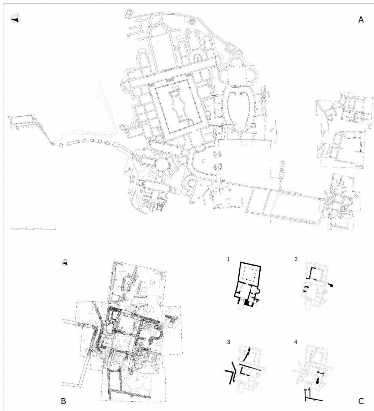
Fig. 1. Planimetria generale della Villa del Casale (A); planimetria delle terme sud (B) con piante di fase (C 1-4).

una piccola sala a sud-est, absidata ugualmente e con mosaico pavimentale, e da un secondo ambiente a sud-ovest con anticamera, dotato di tubuli lungo le pareti e di suspensurae sotto il pavimento, con due piccole vasche, una absidata e l'altra quadrangolare; nell'ultima campagna di scavo si è scoperta a ovest una seconda vasca del frigidario, rettangolare e rivestita di marmi.